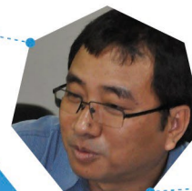
Binota Moy Dhamai Asia Indigenous Peoples Pact (Tailandia)