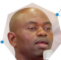
S'bu Zikode Abahlali baseMjondolo (Sudáfrica)