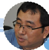
Binota Moy Dhamai Asia Indigenous Peoples Pact (Tailandia)