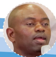
S'bu Zikode Abahlali baseMjondolo (Sudáfrica)